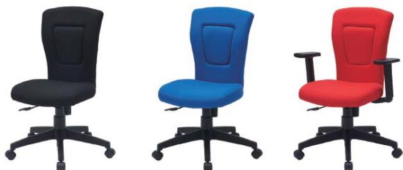
RZC-606BK (ブラック) RZC-606BL (ブルー) RZC-606R (レッド)