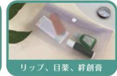
リップ、目薬、絆創膏