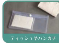
ティッシュやハンカチ

SIAAマークはISO21702法により評価された結果に基づき、抗菌製品技術協議会ガイドラインで品質管理・情報公開された製品に表示されています。